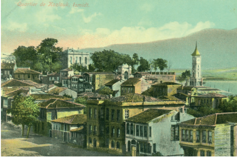
1900'lerin başı, Kozluk Mahallesi'nin genel görünümü.

19. yüzyıl ikinci yarısından itibaren başlayan ve 20. yüzyıl başında da devam eden nüfus hareketlerinin getirdiği Müslüman nüfus kitlelerinin yerleşimine rağmen nüfusun dini bakımdan dağılımına bakılacak olunursa görülür ki bölgedeki gayri Müslim nüfus Türkiye ortalamasının üzerindedir. İstanbul, toplam Müslüman nüfusun % 4,17'sini, İzmit ise 1,69'unu barındırmaktadır. 1914 yılında, toplam 2.391.562 kişi olan gayrimüslim nüfusun 489.876'sı İstanbul'da, 98.294 kişisi de İzmit ve havalisinde oturmaktadır. Oran olarak bu rakamlar İstanbul için toplamın % 14,61'i, İzmit için de % 4,11'ine karşılık gelmektedir. İstanbul toplam nüfusunun % 60,59'u Müslim, % 38,41'i ise gayrimüslimlerden oluşmaktadır. Toplam gayrimüslim nüfusun önemli bir bölümünün adı geçen İzmit ve İstanbul çevresinde meskûn oluşu önemli bir durumdur.