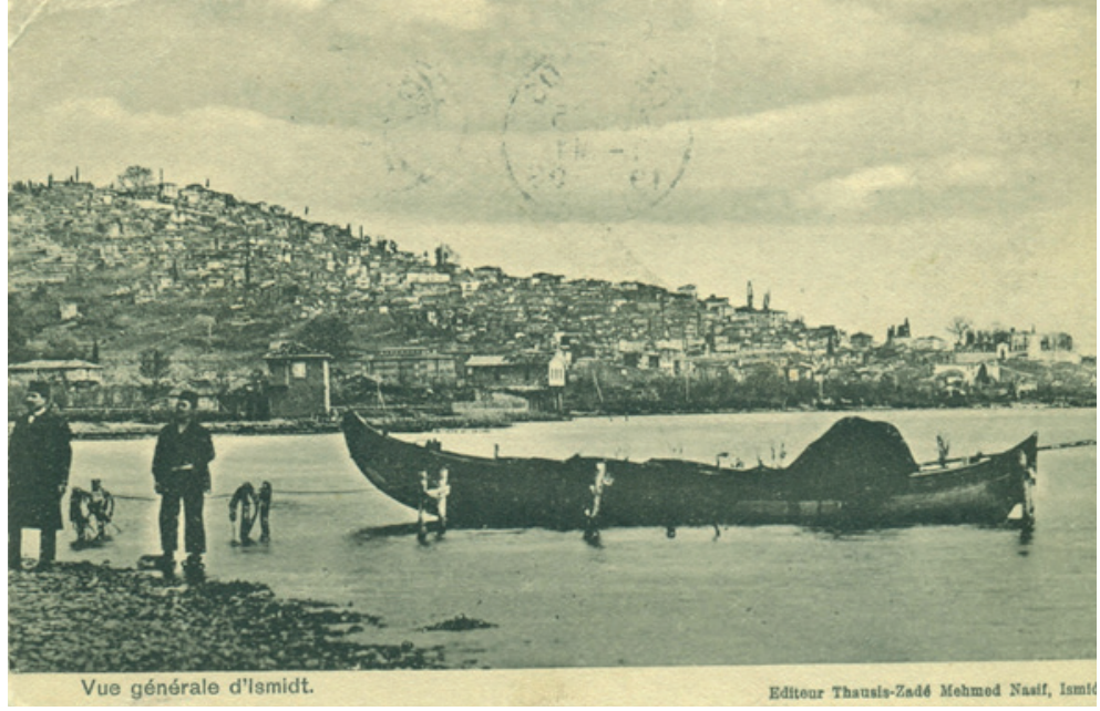
1900'ler, Denizden İzmit'e genel bakış.

16-18. yüzyıl arasında, tahrir, ahkâm defterleri ile şer'iyye sicillerine de yansdığı üzere çok sayıda küçük haneli köy ortaya çıkmış, 19. ve 20. yüzyıllara gelindiğinde, yerleşim öbikleşmesinin bir neticesi olarak ortadan kalkmışlardır. Önceden, askerî kesimin bir gelir alanı olarak varlıklarının korunmasına çalışılan küçük ölçekteki bu köyler yenileşme-dönüşüm döneminde tımar sisteminin ortadan kalkmasına paralel olarak doğal, süreçte yok olmuşlardır.