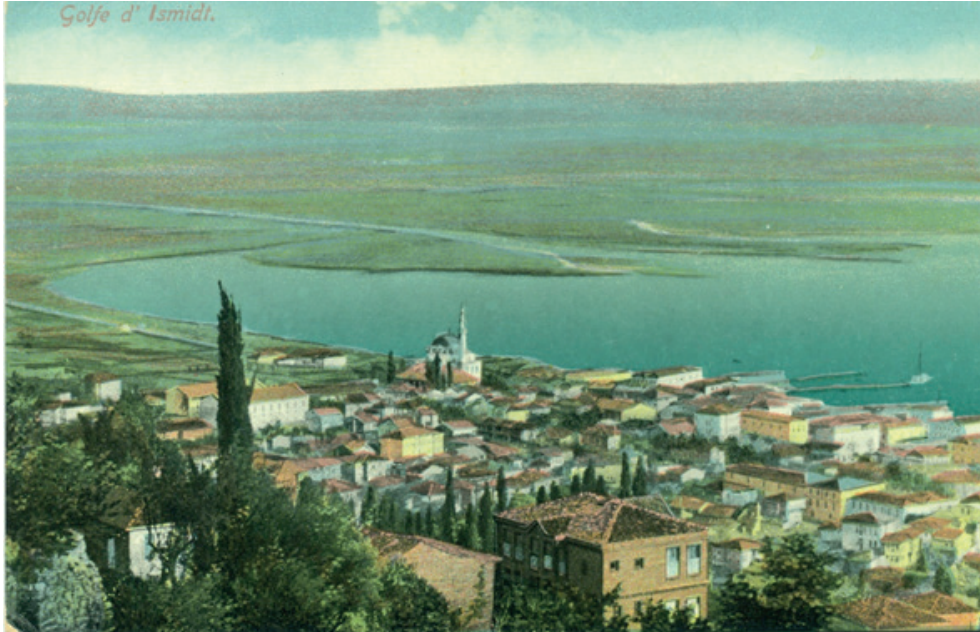
19. yy. sonu, İzmit Körfezi'nin doğusu ve Pertev Mehmet Paşa Cami.

Sistemde Yenileşme ve Dönüşüm Dönemi olarak tanımlanan 19. ve 20. yüzyıllar özellikle 1854 Kırım Harbinden sonra ortaya çıkan, 1877-78 Osmanlı Rus Savaşı, Balkan Harpleri ve Birinci Dünya Savaşı ile devam eden nüfus hareketlerinin Osmanlı sistemini her yönü ile yeniden tayin eden bir etki ortaya çıkardığı alt dönemlerde ele alınabilir. Bu çerçevede Kocaeli yarımadasının, nüfus ve yerleşim temelli önemli bir dönüşüm süreci içinde olduğu görülür.