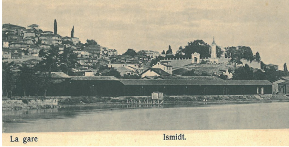
Önde İzmit Tren İstasyonu'nun müştemilatı, arkada ise Saat Kulesi ve Kasr-ı Hümayun (1905)