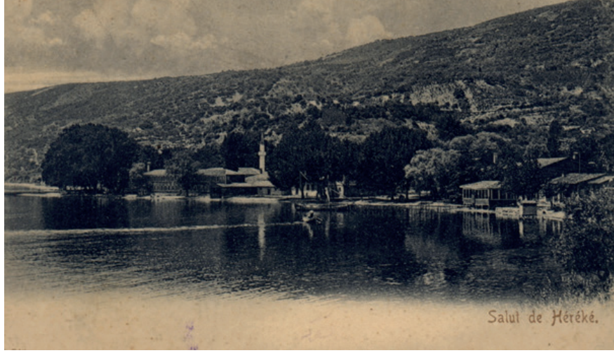
19. yy. sonu, Hereke Sahili ve Hereke Fabrika-yı Hümayunu'nun genel görünümü.

1850 yılında, Hereke Fabrika-i Hümayun 'un pamuklu kısmı Bakırköy'deki fabrikaya taşınmıştır. Hereke'de üretim ise ipek dokumacılığında sürdürülmüştür. 61 Önceleri kumaş üretilen fabrika, 1878 yılında yangın geçirmiş, fabrikada 1891 yılından sonra halı, 1905 yılında yünlü dokuma ve 1908 yılında fes üretimine başlanmıştır. 62 1875 yılına kadar yalnızca saraya çalışmakta olan Hereke Fabrikası'nın üretimine ticari bir yön vermek amacıyla Kapalıçarşı'da bir mağaza açılmış, ancak sarayın müdahalesi ile tekrar kapatılmıştır. Fabrikanın ipekli döşemelik imalatı 1934 yılında kaldırılmış, battaniye imalatı ise 1935 yılında Defterdar Fabrikası 'na nakledilmiştir. 63 Böylelikle fabrika, üretimin çeşitlenmesine bağlı olarak sonraki yıllarda ilave edilen yeni yapılarla genişlemiştir. Hereke Fabrikası'nın yükseltilmiş bodrum üzerine iki katlı dikdörtgen biçiminde olan ilk yapısı günümüze ulaşmamıştır. 1845 yılında Abdülmecid tarafından Hereke'de kurulan dokuma fabrikası, 1850'lerde yapılan eklerle üç katlı bir hale getirilmiştir.