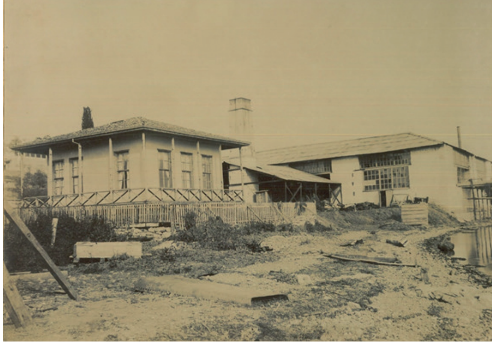
Sultan Abdülmecid zamanında yapılan İzmit Tersanesi'nin Demir Atölyesi

gelmiştir. Değirmendere civarında yapılması düşünülen yeni tersane binalarının arazilerinin keşfi ve haritalarının hazırlanması için bölgeye yabancı mühendisler gönderilmiş, fakat üzerinde önemle durulan bu girişim, o tarihlerde gerçekleşmemiştir. 78