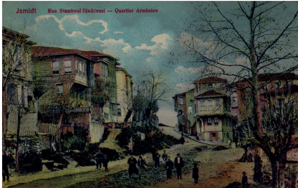
1910'lar, Eski adı İstanbul Caddesi olan bugünkü İnönü Caddesi'nden, Rasathane'ye doğru çıkan yoldaki Ermeniler

İzmit Bizanslara kadar geçmiş olan bir körfez şehri olarak karşımıza çıkar. Osmanlı topraklarına katıldıktan sonra da kadim kültürlerin getirdiği tecrübeyi yaşam renklerinde barındırdığını görüyoruz. 16. ve 17. yüzyıllar da İzmit mahallesi geçiş yollarında olmanın getirdiği avantajları da kullanarak gelişimini sürdürdüğü gibi yeni kültürel renkleri de kendine çekmeye başlar. Ermeniler de 16. yüzyıldan itibaren Sivas'tan buraya göç ederler.