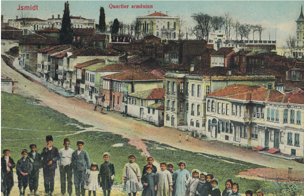
1900'lerin başı, İzmit'te Ermeni çocuklar

Bir başka Ermeni şehri olan Bahçecik'te yaşamın daha başka bir şekillendiği görülmektedir. İpek böcekçiliğinin ana geçim kalemi olduğu, sırtını engin dağlara dayamış İzmit körfezini tepeden gören bir yerleşim yeri olan Bahçecik Ermeniler tarafından kurulmuştur. Yazların İstanbul Karaköy'de vapurların kaldırılıp İstanbullu Ermenilerin piknik yapmak için geldikleri