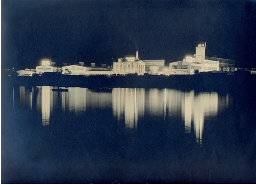
1936. Cumhuriyet Bayramı nedeniyle ışıklandırılmış olan fabrikanın, gece denizden görünümü.

SEKA, kurulduğu yıllarda kendi motor ve sistemleriyle İzmit'in bir kısmının elektrik ihtiyacını karşılamaktaydı. Zamanla merkezî elektrik sisteminin kurulmasıyla bu hizmetten çekildi. Bununla birlikte işletme için kurulmuş bulunan itfaiye teşkilatı büyük yangınlarda İzmit itfaiyesine yardıma koşmaya devam etti. Bundan başka SEKA, kimi zaman uzak köy yollarının yapım işine de katkı sağlıyor, bazı köy okullarının tamiratını, boya, badana işlerini üstleniyordu. SEKA'nın İzmit'in sembolü olan Saat Kulesi'ni tamir etmesi de döneminde halkın sevgi ve takdirini kazanmasına neden olmuştu. Sadece Saat Kulesi tamir edilmemiş, çevre düzenlemesiyle, Kule'ye verilen ışıklarla hoş bir görünüm de sağlanmıştı. 16 Hiç kuşkusuz kâğıt ve selüloz fabrikalarında çalışan işçiler için kurulan İşçi Sigortaları Hastanesi (SEKA Devlet Hastanesi) de SEKA'nın İzmit'e yaptığı en önemli kazanımlardan birisidir.