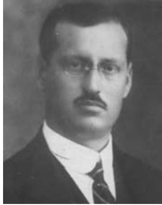
Resim-1: İsmail Canbolat 6

1912 yılında İzmit milletvekili olarak Mebusan Meclisi'ne girmiştir. 5 Balkan Savaşı'na gönüllü yedek subay olarak katılmıştır.